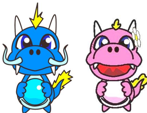
土佐市マスコットキャラクター